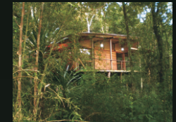
Cabaña Don Valentín