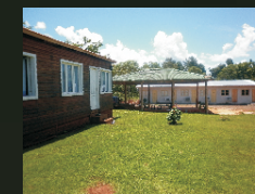
Alojamiento Tierra Verde