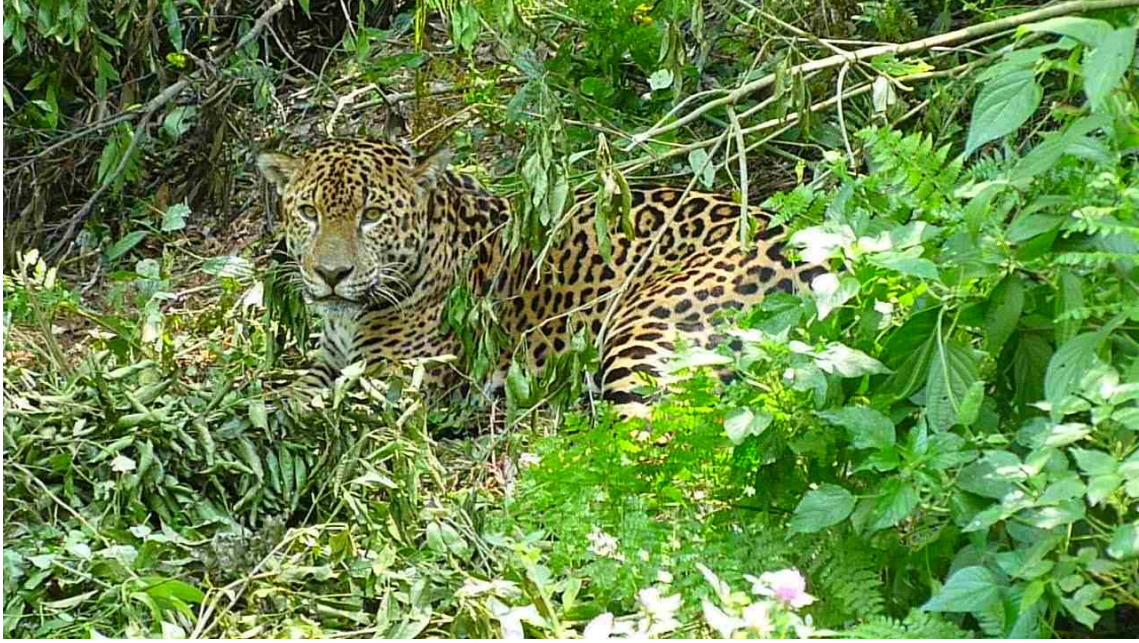
Figura 1. Imagen del animal durante la captura en el año 2010