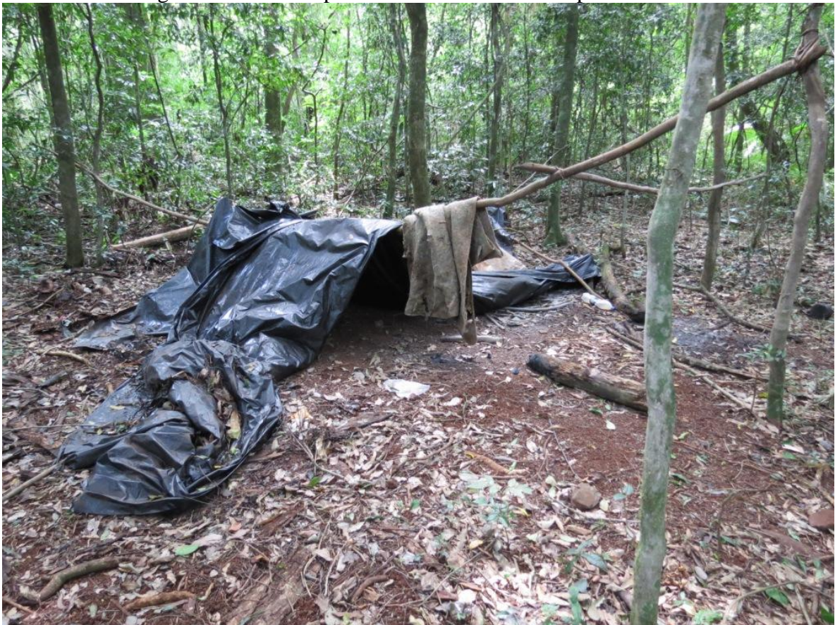
Figura 7. Restos del campamento donde se encontró el animal cazado.