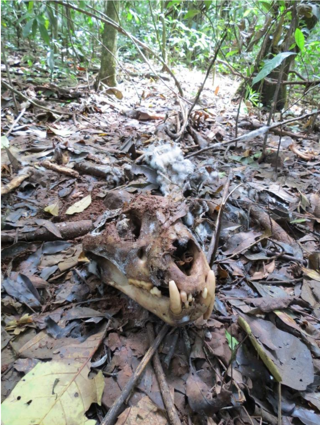
Figura 5. Los restos del yagareté encontrados. En la foto se observa que al cráneo le falta el canino superior derecho, con signos de haberlo perdido hace tiempo.