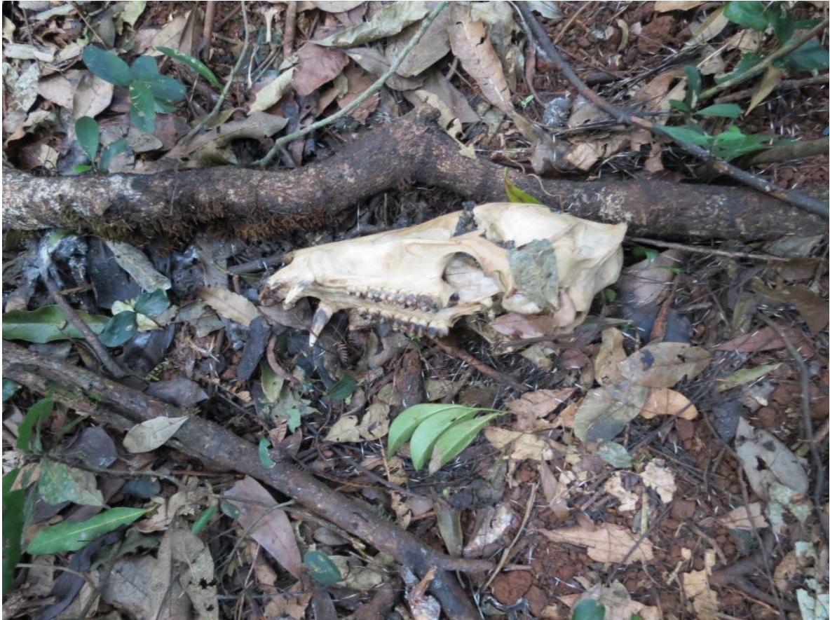
Figura 6. Cráneo de pecarí encontrado en el campamento.