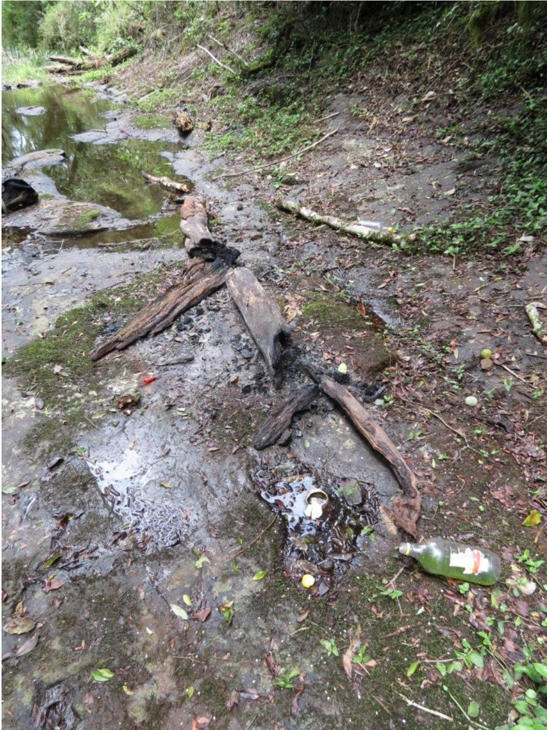
Figura 4. Restos de un fogón con cartuchos de escopeta.