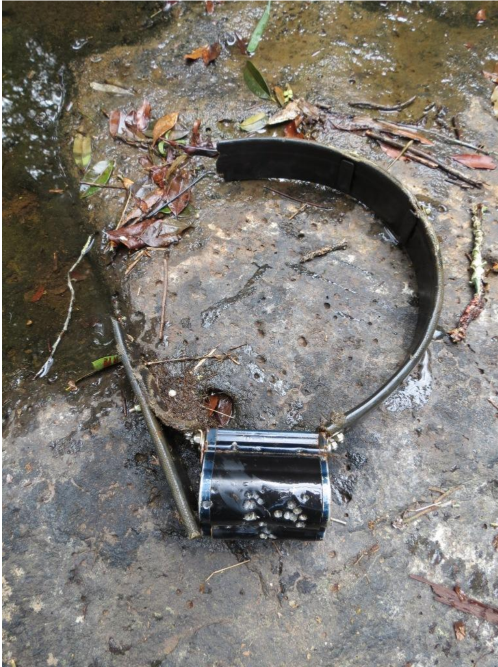
Figura 3. El collar GPS cortado y baleado