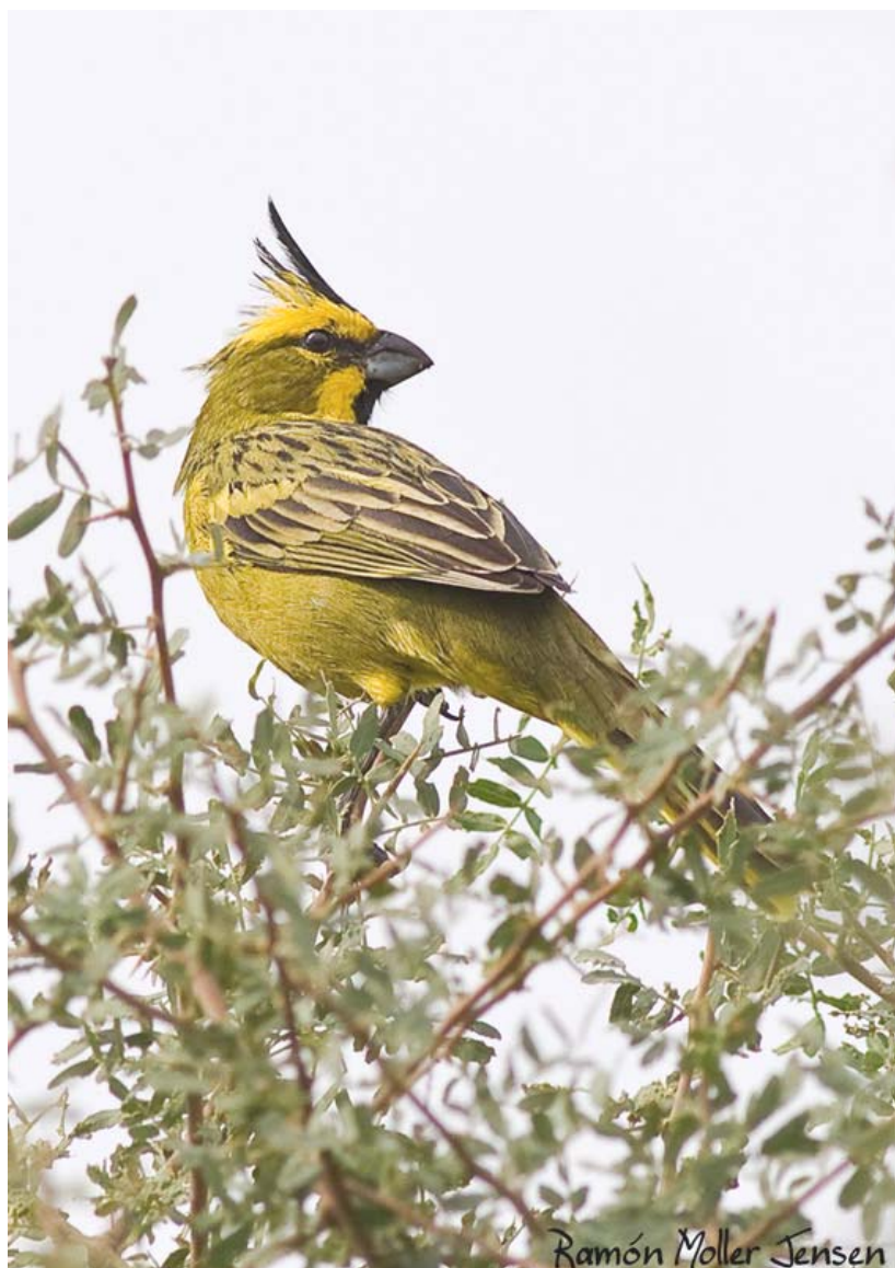
Cardenal amarillo ( Gubernatrix cristata ) macho en áreas de ecotono con los Bajos Submeridionales y el ambiente típico de la especie