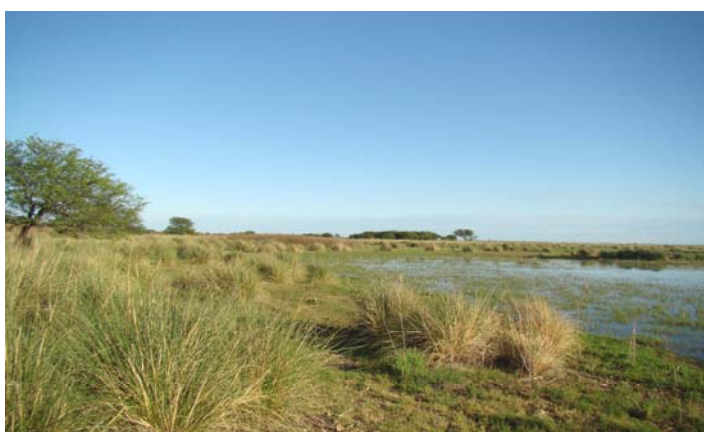
Lavandera ( Arundinicola leucocephala ) macho y hábitat asociado