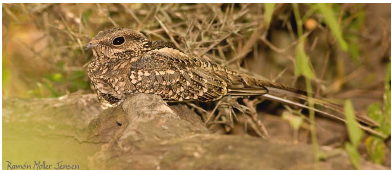
Atajacaminos tijera ( Hydropsalis torquata ) macho en el área de ocotono con el domo occidental