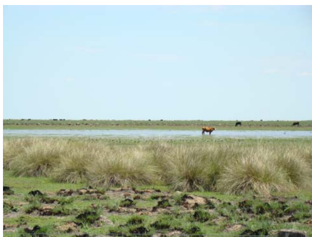
Charcas temporarias luego de algunas lluvias cuantiosas en el mes de octubre de 2008. De vez en cuando algunos sitios presentan montes de espinillos y árboles aislados. Cielos despejados e intensa radiación solar fue lo típico en la mayoría de los días de estudio