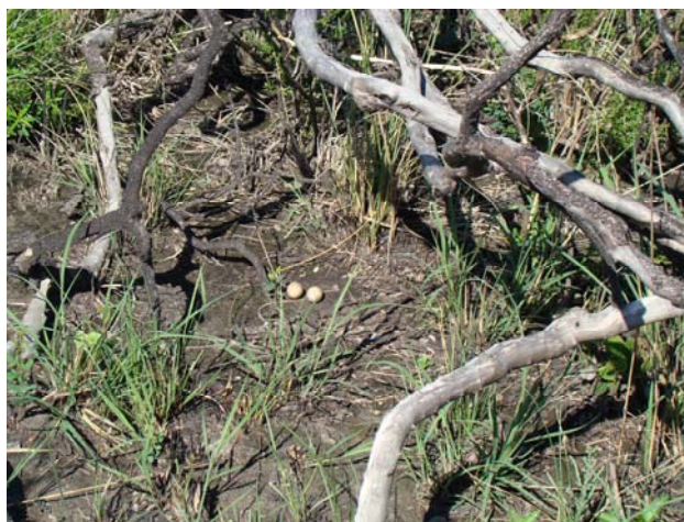
Atajacaminos tijera ( Hydropsalis torquata ) hembra con nido en un mogote incendiado.