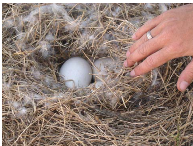
El paisaje acuático de los Bajos Submeridionales aún en plena sequía 2008/09: llanuras de inundación del río Salado en La Costa y nidos de Coscoroba coscoroba